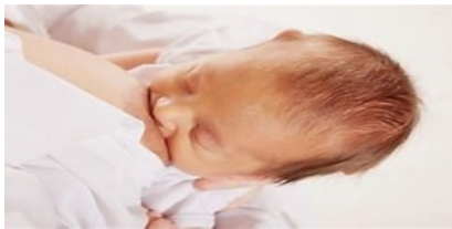
ATTACCO PRECOCE IN SALA PARTO