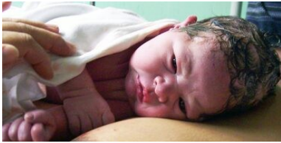
SKIN TO SKIN