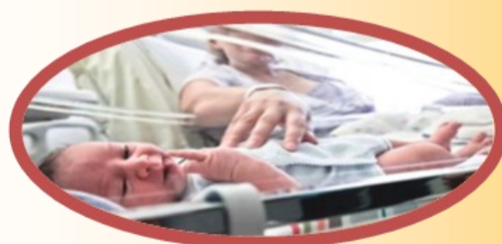
Rooming – in