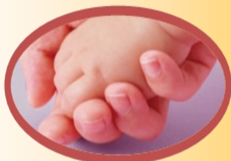
Taglio ritardato del cordone e Donazione