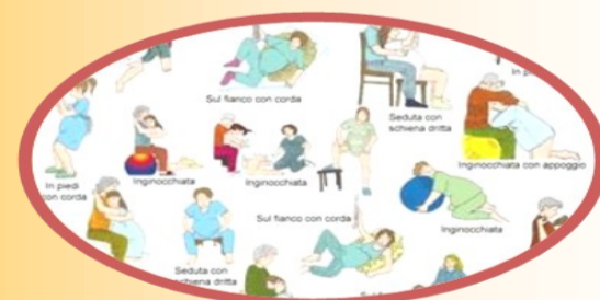
Posizioni libere in travaglio

Siamo lieti di invitarVi all' Open Day il giorno 29 Marzo dalle ore 9:00 alle ore 12:30 presso la U.O.C. di Ostetricia, situata al 6° piano dell' Ospedale "F. Spaziani" di Frosinone. Vi illustreremo i servizi ambulatoriali dedicati alle gestanti a partire dalla 36° settimana, il percorso assistenziale in travaglio e parto, l'accoglienza al neonato, l'allattamento e informazioni per il ritorno a casa.