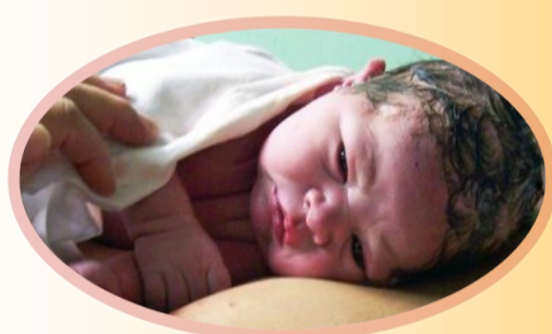
Skin to skin

Il tuo benessere è... il nostro obiettivo